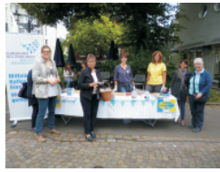
Butterbrot-Aktion "Netz gegen Armut"